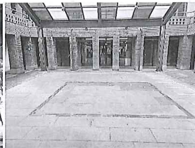
臨水街 6 號廣場