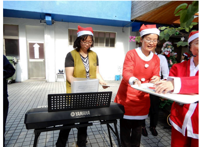
參與慈青社護理之家聖誕義演活動