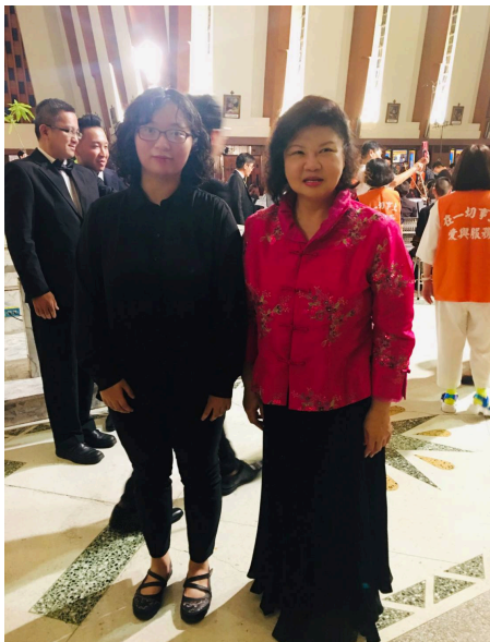
擔任聖家堂合唱團鋼琴伴奏