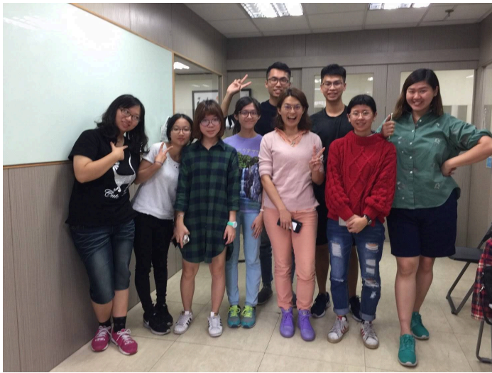
與知名表演藝術大師學習戲劇與演出