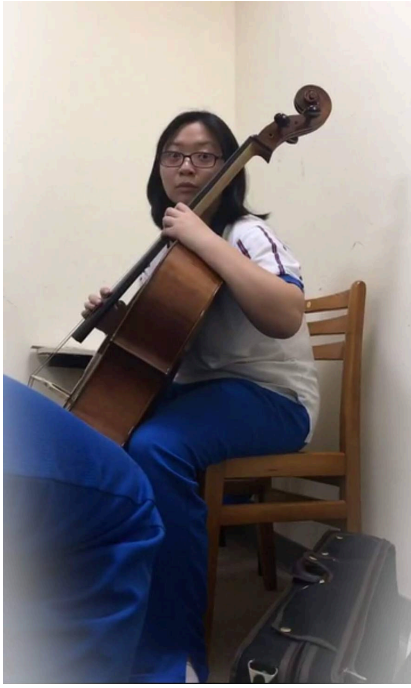
雖高二換副修作曲卻從未放棄 喜愛的第二副修大提琴