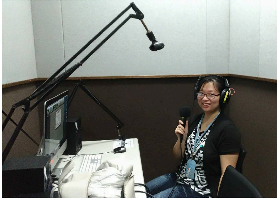
臺藝之聲電台主持人（有YOUTUBE 頻道：謎樣女孩）